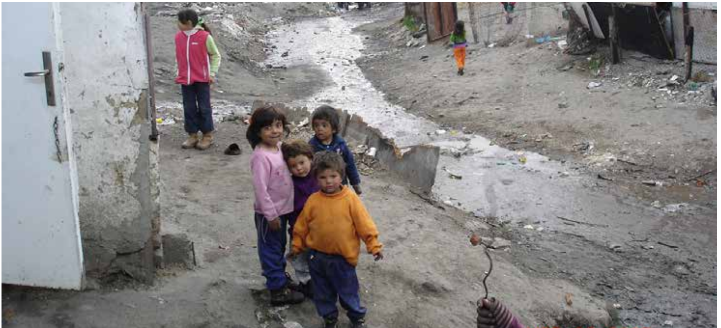
Omtrent slik så det ut i leiren i Hellas, bare mye mer folk. Dette bildet er fra en annen leir.

Flere av disse som ble frelst den gangen har vi nå kontakt med og er ivrige sjelevinnere. Når slike kommer og ber om videre hjelp, kan vi ikke si nei. Det er i dette området vi nå skal ha et av storstevnene.