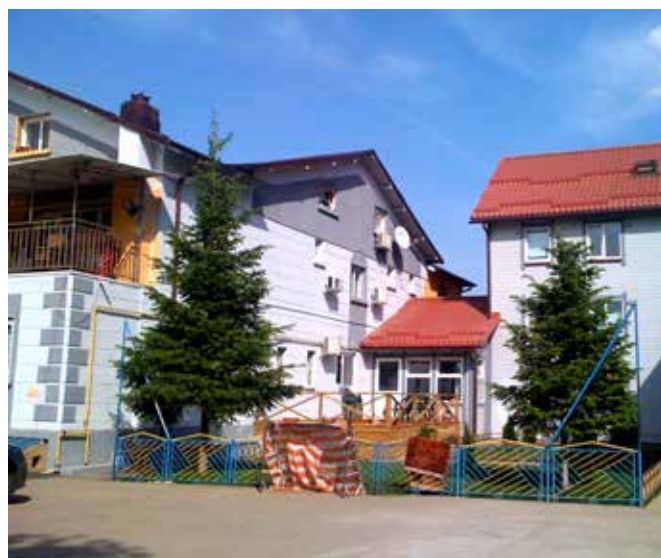
Liv og Lys senteret i Bucharest

Arbeidet nasjonalt går veldig bra. Vi har dyktige medarbeidere og ledere, men det er jo klart at de fortsatt vil være avhengige av den økonomiske støtten en tid framover. Derfor jobber vi her hjemme i Norge for å få nok støttepartnere til å ta ansvar slik at prosjektene kan gå videre.