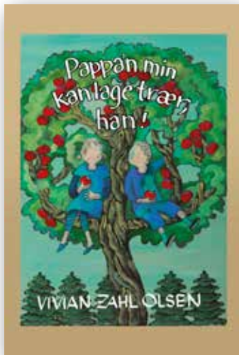
Boka Pappa'n min kan lage trær, han! Hermon Forlag