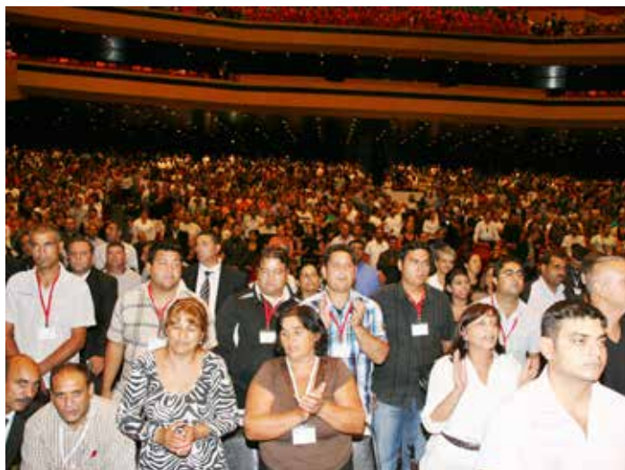
Fra en av de mange konferanser vi har hatt.

V ekkelse er som en ildebrann. Den sprer om seg som ild i tørt gress. Hundrevis blir frelst og nye menigheter plantes. De nye predikantene som kommer ut fra våre bibelskoler er ivrige og setter i gang nye menigheter. De starter gjerne med egne familier, deretter slektninger og venner. Når det blir for trangt om plassen i hjemmene blir det leid kommunehus, skoler og samfunnshus. Etter en tid blir det samlet nok penger til å sette i gang med bygging. Vi har opprettet en byggekasse hvor de menigheter som har mulighet kan være med å gi et offer. Europa i Fokus er jo en selvsagt resurs som bidrar til dette. På denne måten vokser det fram menighet etter menighet. Til tross for stor fattigdom og mange utfordringer, drar de fra by til by og forkynner evangeliets budskap. Mange av predikantene