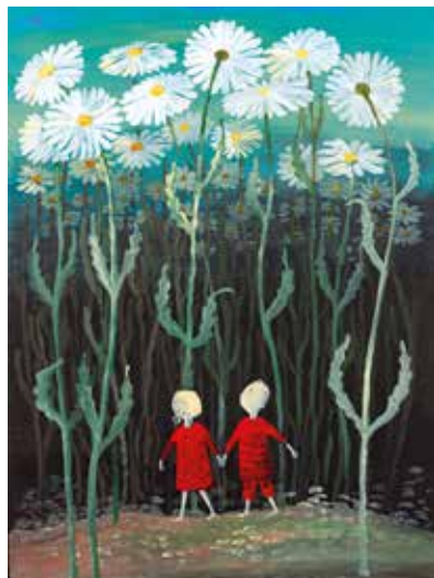
Illustrasjon fra boka Pappa'n min kan lage trær, han!