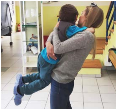
Ikke alle får en slik velkomst når de kommer på jobb.