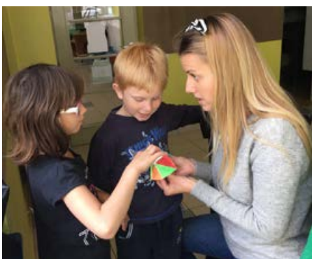
Å Leke og lære samtidig er ingen dårlig kombinasjon.