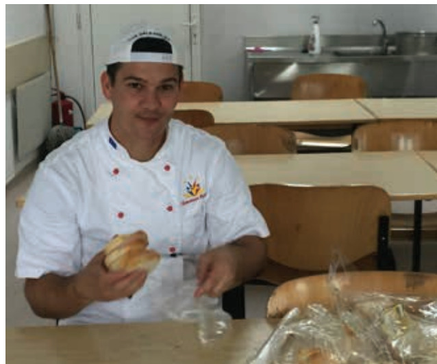
Kokken vokste opp på hjemmet, fant kona si der og er i dag gift og har to barn.

Vi får en del takkebrev og blader i retur. Vær så snill, send oss din adresseendring!