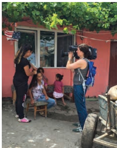
NRK Brennpunkt lager dokumentar om Romfolkets situasjon.

Gå inn på hjemmesiden: www.europaifokus.no eller på Facebook: Hjelpeorganisasjonen Europa i Fokus Bloggen til Thomas: https://detglemtefolket.wordpress.com