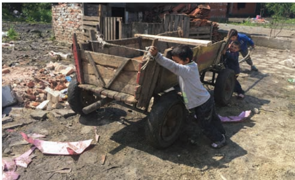
Hestevogna bruker far for å samle skrot, men den kan også brukes som leketøy!